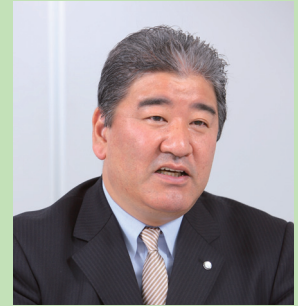
オーイーエル株式会社 代表取締役社長